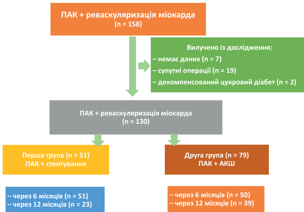
Рис. 2. Схема залучення пацієнтів з ішемічною хворобою серця та супутньою патологією аортального клапана у дослідження. ПАК – протезування аортального клапана; АКШ – аортокоронарне шунтування

Надалі ми проводили порівняльний аналіз основних доопераційних ехокардіографічних показників ( табл. 2 ).